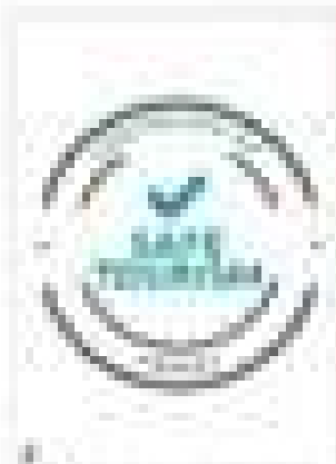
図2-2 海外観光立国政策の推進

海外観光立国政策の推進は、観光産業の発展と経済成長の促進に寄与する。しかし、新型コロナウイルス感染症の世界的流行により、海外観光立国政策の推進が困難な状況に陥った。しかし、2022年以降にインバウンド観光回復を期待する外国人観光客の増加を、積極的に対処して、観光立国政策を推進する必要がある。本調査では、海外観光立国政策の推進に向けた取り組みについて、関係者へのインタビューを通じて、現状と課題を明らかにする。