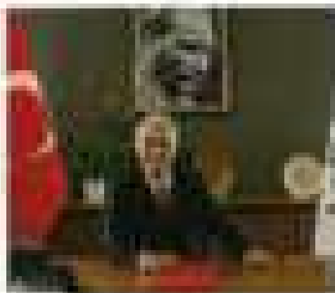
図2-1 海外観光立国政策の推進

海外観光立国政策の推進は、観光産業の発展と経済成長の促進に寄与する。しかし、新型コロナウイルス感染症の世界的流行により、海外観光立国政策の推進が困難な状況に陥った。しかし、2022年以降にインバウンド観光回復を期待する外国人観光客の増加を、積極的に対処して、観光立国政策を推進する必要がある。本調査では、海外観光立国政策の推進に向けた取り組みについて、関係者へのインタビューを通じて、現状と課題を明らかにする。